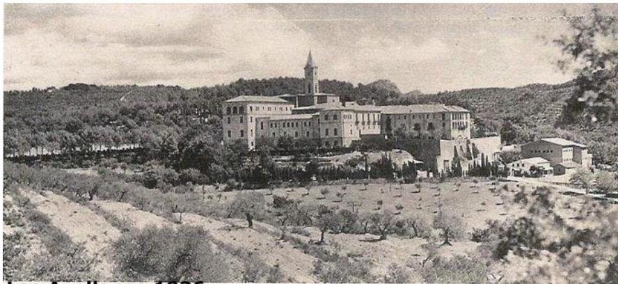
Las Avellanas 1936

Una palabra sobre la causa del grupo de mártires del Hermano Crisanto. Este grupo cuenta con 68 mártires: 66 hermanos y 2 laicos. La 'positio' o libro de la demostración del martirio ha sido entregada a la Congregación de los santos el 7 de diciembre de 2001. Después de nueve años de espera, hoy se encuentra en la posición nº 22 del conjunto de causas y en 7ª posición por lo que respecta a las de los mártires de España. Esto permite esperar que la 'positio' sea estudiada a lo largo del año 2012 por los teólogos, y en 2013 por los cardenales y obispos. La beatificación se podría prever para 2014... Pedro podríamos esperar hasta 2017, para enmarcarla en el bicentenario de la fundación del Instituto.