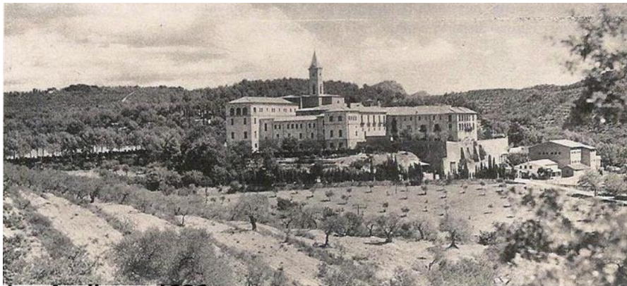
Las Avellanas 1936

U ma palavra sobre a causa do grupo de mártires do Irmão Crisanto. Esse grupo conta com 68 mártires, 66 Irmãos e 2 leigos. A 'positio' ou livro demonstrativo do martírio, foi entregue à Congregação dos santos, no dia 7 de dezembro de 2001. Após nove anos de espera, encontra-se hoje na 22ª colocação no conjunto das causas e na 7ª posição no que se refere às causas dos mártires da Espanha. Isso permite supor que a 'positio' será estudada ao longo do ano de 2010, pelos teólogos e, em 2013, pelos cardeais e bispos.