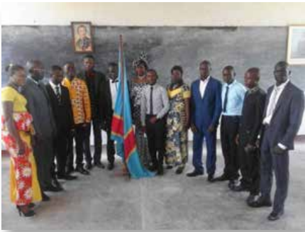
Rep. Dem. del Congo: Université Mariste du Congo