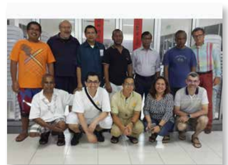
Malasia: Conferencia Marista de Asia se reúne en Kuala Lumpur