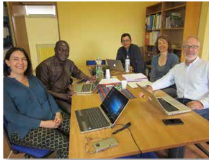
Casa Geral: reunião para desenhar a Fase II do Programa de formação Novos Horizontes