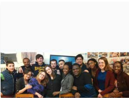
Canadá: Comunidade de acolhida de Willowdale