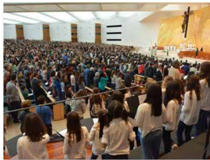
Portugal: Peregrinação marista a Fátima