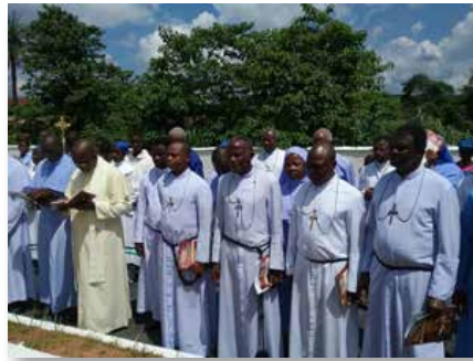
Nigeria: Celebración del Bicentenario