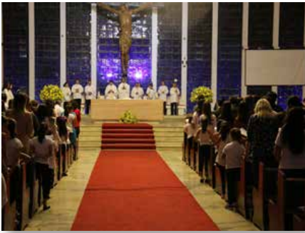
Brasil: Celebración del Bicentenario, en Brasilia