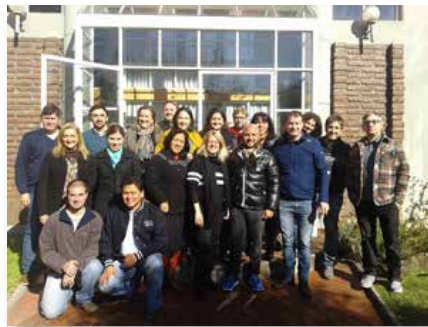
Chile: reunión anual de la oficina FMSI Cono Sur