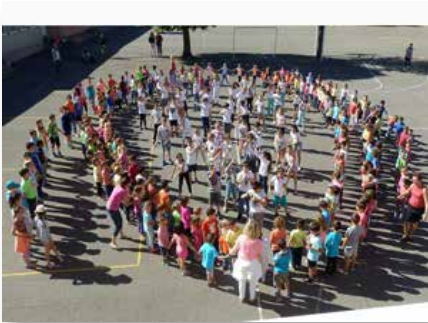
Francia: Chazelles sur Lyon