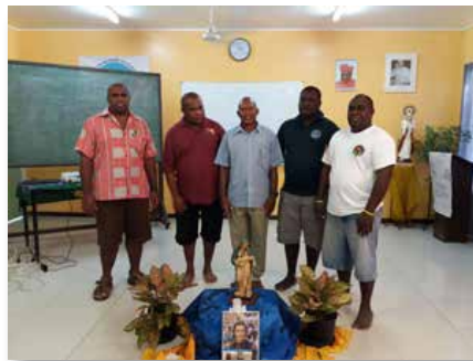
Papúa-Nueva Guinea: Consejo del Distrito de Melanesia