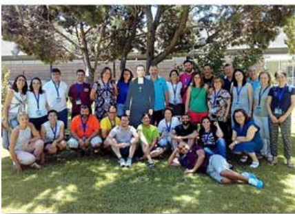
Casa general: Curso de Acompañamiento para maristas de Europa