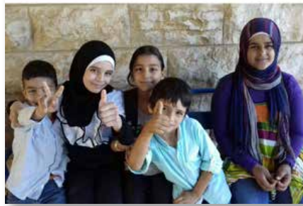
Libano: Proyecto Fratelli