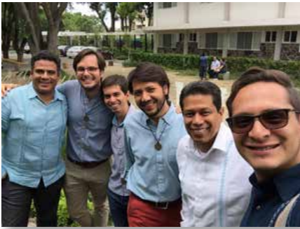
México: Zapopan, Jalisco