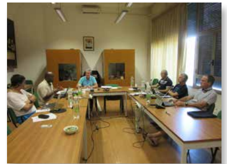
Casa general: Reunión de la Comisión Internacional de Revisión de las Constituciones