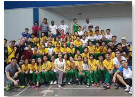
Filipinas: MAPAC Coaching module