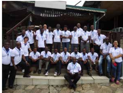
Ghana: Taller con los laicos maristas