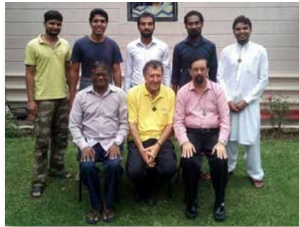
Sri Lanka: Retiro para los Hermanos de Sri Lanka y Pakistán, Ampitiya (Kandy)