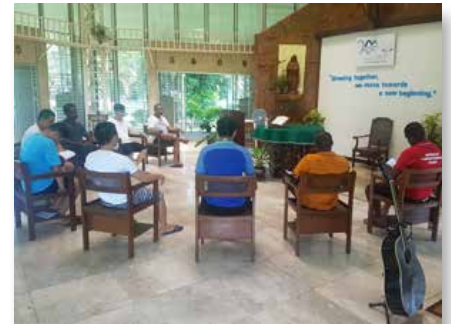
Filipinas: MAPAC (Marist Asia-Pacific Center)