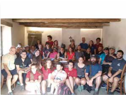
Francia: Jóvenes maristas del Canadá en La Valla