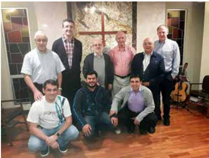
Guatemala: Comunidad Residencia Provincial América Central