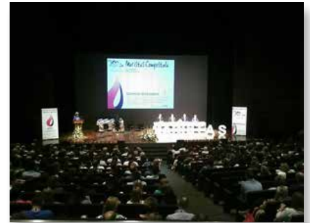
España: Convención de educadores, Provincia Compostela

Convocados por la Comisión Nacional de Pastoral Juvenil y animados por los Hermanos Maristas, los jóvenes provinieron de Ciego de Ávila, Santa Clara, Cienfuegos, Matanzas, La Habana y Pinar del Río.