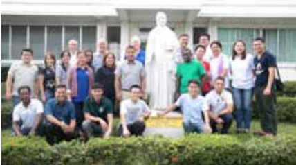
Filipinas MAPAC: seminário sobre os direitos das crianças