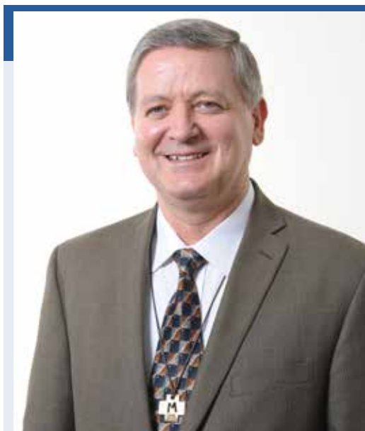
FOTO OFICIAL DO SUPERIOR GERAL