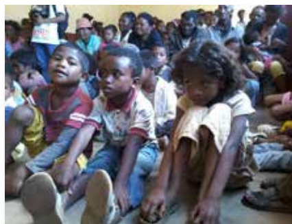
Madagascar: Leigos maristas doam presentes às crianças necessitadas em Antsirabe