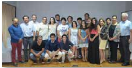
Chile: Instituto O'Higgins Rancagua