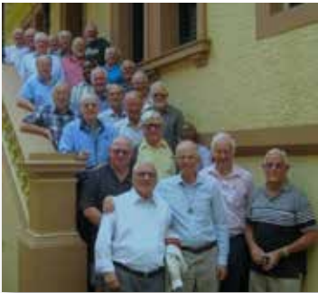
Austrália: Retiro em Adelaide