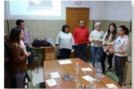
Espanha: Voluntarios Maristas Compostela