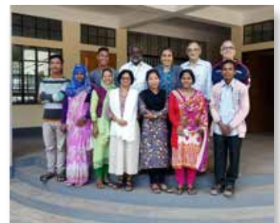
Bangladeche: Seminário de professores na escola St. Marcellin, Moulvibazar