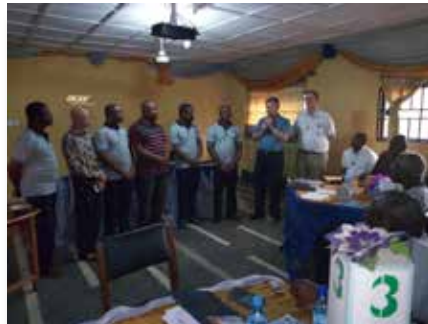
Nigeria: Capítulo provincial, Orlu