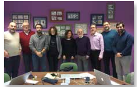
España: Red de Equipos de Comunicación de Maristas en España