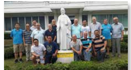
Filipinas: Reunión de formadores asiáticos en MAPAC, Manila