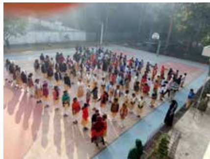
Bangladesh: St. Marcellin School, Giasnogr