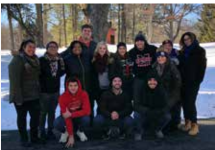
Estados Unidos: Comité Consultivo de Adultos Jóvenes