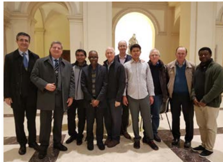
Italia Gregorian University