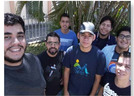
El Salvador: Aspirantes maristas en la comunidad de Mejicanos