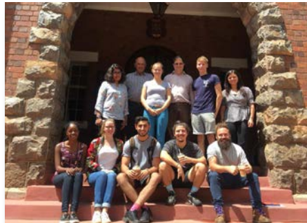
África do Sul: Voluntários do projeto Three2six, Joanesburgo