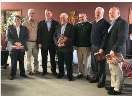
Estados Unidos Nuevo Consejo Provincial