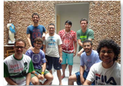
Brasil Postulantes en Maraponga