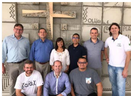
Brasil: Reunión de la Equipe Vocacional de América Sur, en Curitiba