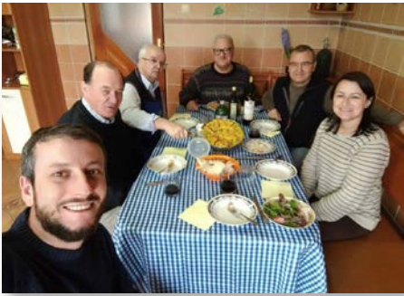
Rumania: Formadores visitan la comunidad Lavalla200> de Moinesti