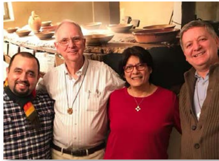
Estados Unidos: El superior general visita la comunidad Lavalla200> Harlem, Nueva York