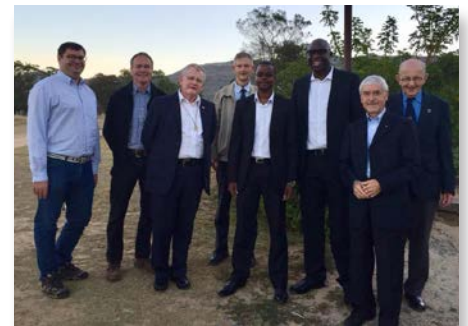
Sudáfrica: Centenario del St Joseph's Marist College, Rondebosch, Cape Town