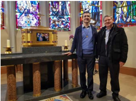
França: Irmãos Superior Geral e Vigário Geral em l'Hermitage