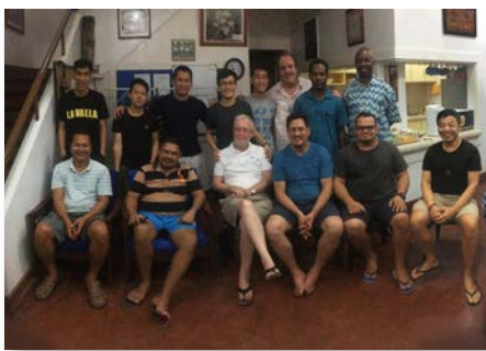
Filipinas: MAPAC e a Comissão Internacional de Irmãos Hoje, Manila