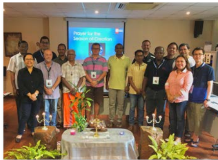
Singapura: Encontro das comissões de Espiritualidade, Leigos e Missão da Ásia