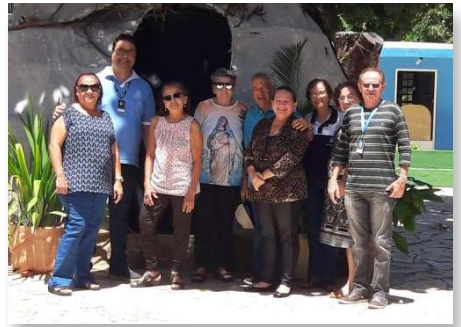
Brasil: Encontro da fraternidade marista Nossa Senhora da Apresentação, Natal