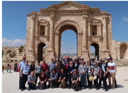
Jordânia: Associação marista australiana de São Marcelino Champagnat, Jerash