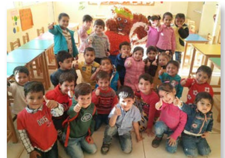
Líbano Projeto Fratelli, Rmeileh