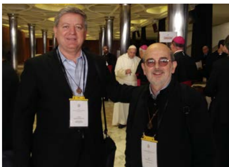
Vaticano: Encuentro sobre a proteção dos menores na Igreja