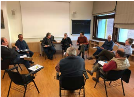
Italia Retiro del Consejo general en Nemi