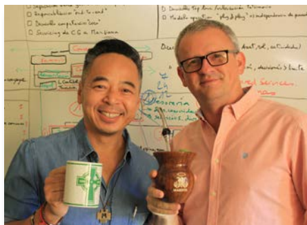
Casa general: Encuentro de integración del Consejo general con los secretariados