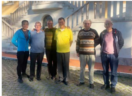
Italie: Équipe internationale de formation permanente mariste et communauté à Manziana