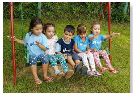
Brésil Ilha Grande dos Marinheiros, Porto Alegre