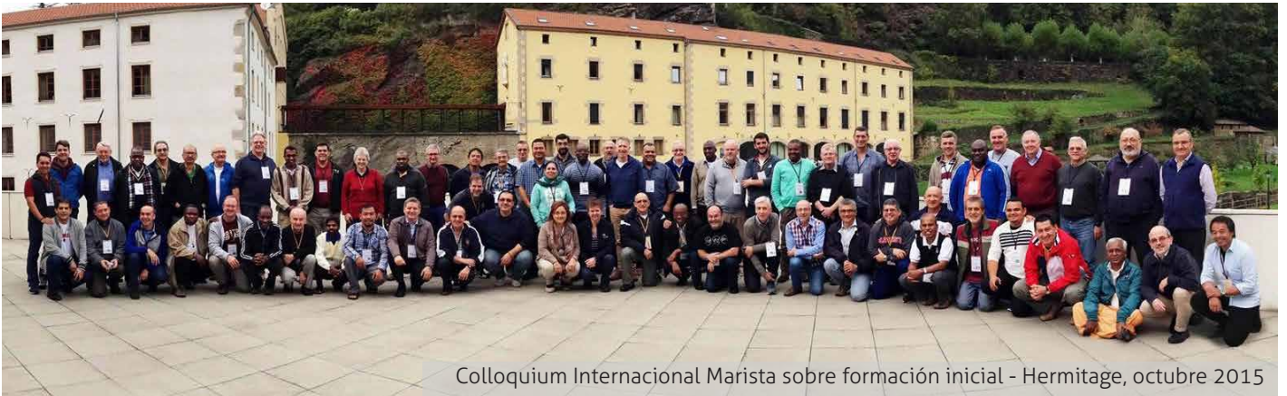
Colloquium Internacional Marista sobre formación inicial - Hermitage, octubre 2015