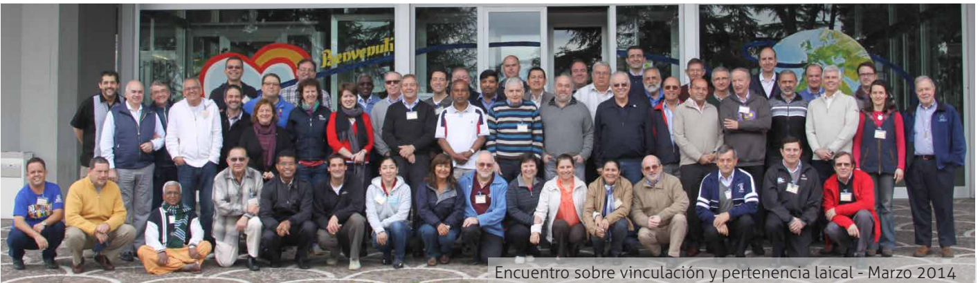
Encuentro sobre vinculación y pertenencia laical - Marzo 2014