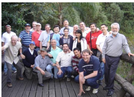
Hermanos y laicos maristas

Vivir con otros el carisma marista es vivir una experiencia de comunión. Y aquí se introduce la dimensión comunitaria., como asociación de personas que tejen entre sí lazos fraternales, a partir de una idéntica experiencia: la de haber sido atrapados por Dios en el seguimiento de Jesús, con el espíritu de Champagnat. Esta dimensión comunitaria es eje de la experiencia carismática y permite hacer la síntesis personal de los elementos constitutivos de nuestra vocación., como son la espiritualidad, la misión y la fraternidad maristas.