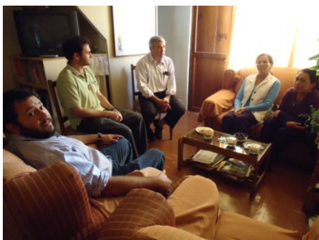
Comunidad compartida de La Serena – Chile

La comunidad es el lugar de intercomunión de las personas. La comunidad engendra las personas y las personas engendran la comunidad. No se da la una sin la otra. Alguna forma de comunidad es esencial a todas las formas de vida humana. Dice un autor: Desde la más sana antropología y desde la más elemental visión evangélica de la vida, hemos de afirmar que la calidad de la convivencia es condición esencial para cultivar una buena calidad de vida, a nivel humano y a nivel evangélico. Para tener calidad de vida necesitamos los seres humanos una comunidad sana y saludable, una convivencia armoniosa, una comunicación que nos libre de nuestras soledades "deshabitadas".