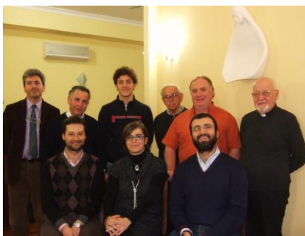
Comunidad mixta de Giuliano, Italia

En esta experiencia laicos y hermanos viven en una misma casa. Entre otras referencias citamos a las comunidades de Mulhouse, Hermitage, Giugliano... El proyecto contempla una apuesta por el carisma marista vivido en el día a día a partir de la complementación vocacional. Se comparte el trabajo, la oración, la reflexión. Se acuerdan ritmos comunitarios. Se acentúa la comunicación desde la apertura sincera, el diálogo y la escucha. Se vive el reto de aceptar el pluralismo y construir la convivencia.