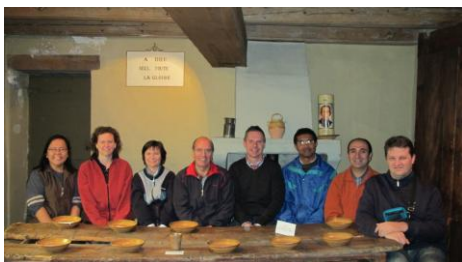
Secretariado de laicos - Hermitage

La dimensión comunitaria puede aparecer en la dinámica de un equipo, comisión o grupo de animación, sea local, provincial o regional. Sentirse comunidad es más que verse como entidad organizativa o promotora. En todo grupo que quiere constituirse como comunidad prima el discernimiento, el diálogo, la escucha, la comunión. Se experimenta antes lo que se quiere promover. Se vive antes lo que se quiere anunciar. Se crean espacios para compartir vida, momentos fuertes de oración, tiempos de ayuda mutua.