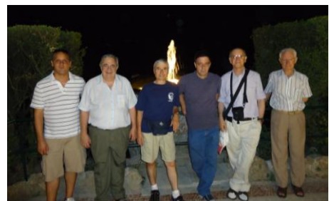
Comunidad de Roma

Las relaciones gratuitas, igualitarias, serviciales, solidarias de los miembros de la comunidad y de ésta misma con otros grupos, se convierten en el mejor testimonio en un mundo abocado a las relaciones comerciales, discriminatorias, utilitarias, insolidarias. La comunidad de los hermanos puede ser un laboratorio de convivencia justa y fraterna para otros grupos maristas y para toda la sociedad.