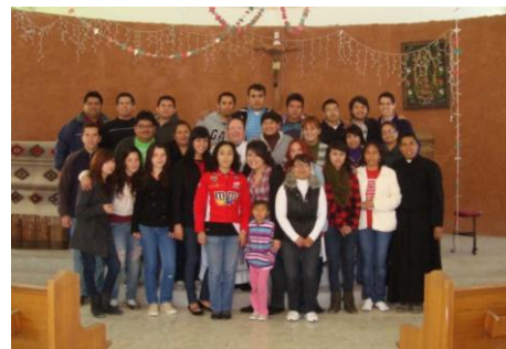
Misioneros maristas de Ciudad Juárez, México

Los Misioneros Maristas se iniciaron siendo un pequeño grupo de alumnos del bachillerato marista. Ahora son exalumnos, maestros y otras personas que, sin tener ningún contacto con lo marista, se han unido. Sienten que el Espíritu de Dios les ha hecho el regalo de querer vivir la espiritualidad marista, desde la base laical. Su sueño es poder decirles a todas las personas que Dios las ama mucho , en especial a los niños y jóvenes, que se encuentran en zonas rurales y periféricas de la ciudad, a través de los rasgos maristas: espíritu de familia, amor al trabajo, sencillez, presencia amorosa y, sobre todo, la devoción a nuestra Buena Madre María Santísima.