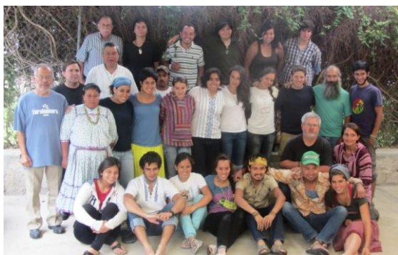
Hermanos y voluntarios maristas en la Tarahumara, México.

La Provincia de Cruz del Sur habla de comunidades ampliadas. Son aquellas en las cuales la comunidad religiosa de hermanos, junto a algunos laicos y laicas más comprometidos con la historia de la obra marista en el lugar, se plantean corresponsablemente la misión, a la vez que se sostienen recíprocamente en sus vocaciones específicas a través de la oración y la reflexión conjunta. Con sus particularidades, esas comunidades ampliadas ya existen en Nueva Pompeya y en Fraile Pintado. El Consejo Provincial acuerda impulsarlas en Neuquén, Merlo, La Inmaculada (Capital Federal), La Boca, Pando y en el Equipo animador de la Pastoral Juvenil Provincial.