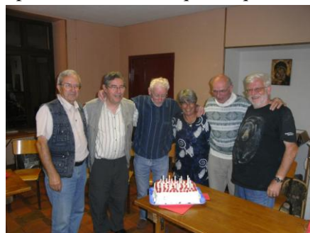
Comunidad de Mulhouse, Francia.

La comunidad de Mulhouse (Francia) es una experiencia que nace de la iniciativa de un matrimonio. Con los hermanos comparten la misma casa, que es de los laicos, y una misión común hacia los jóvenes. Son ya 15 años de recorrido. El