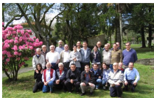
Grupo de los IDEM en Roxos, España.