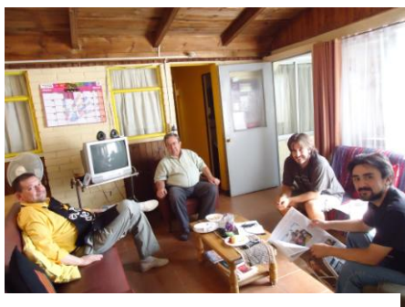
Comunidad ampliada de La Pintana - Chile

En general, las comunidades en medios populares han extendido esta práctica de acoger a voluntarios laicos durante un tiempo. El objetivo de la presencia laical suele ser el realizar una experiencia de misión. La interacción entre los hermanos y los laicos suele ser en estos casos de acogida, trabajo en común, convivencia. Se suele dar libertad a los laicos para participar de los ritmos de oración, reuniones comunitarias... pero no suele haber un proyecto común de vida, donde todos hayan colaborado en su elaboración y diseño.