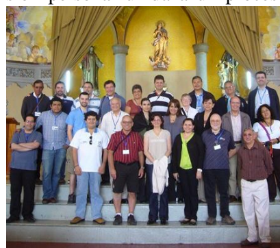
Hermanos y laicos maristas. Arco Norte

Vivir con otros el carisma marista es una manera de entender la nueva relación , que nos habla el XXI Capítulo General. Creemos que es el Espíritu quien está invitando a multiplicar en la Iglesia distintas formas de vivir la comunión y el mutuo enriquecimiento entre religiosos, laicos y laicas. En el fondo, estas expresiones comunitarias ponen en evidencia una nueva manera de vivir como Iglesia.