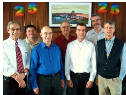
Comunidad de hermanos maristas y hermanos del Sagrado Corazón, en Québec.