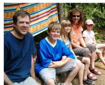
Familia marista de Canadá

Para muchos laicos y laicas el matrimonio es parte fundamental de su vocación laical. En su mutua entrega de esposos transparentan el amor de Dios, siempre fiel, en medio del mundo. La familia es el primer lugar donde vivir la comunión, esencia de toda expresión comunitaria. En la comunión familiar se crece como personas y seguidores de Jesús. Junto a las normales dificultades y conflictos que surgen en la vida de las familias, en ellas madura también la comprensión en la pareja, la abnegación en el cuidado de los hijos y de los mayores o enfermos, la acogida de cada uno en sus diferencias, la unión para que todos puedan vivir dignamente y cada uno encuentre su