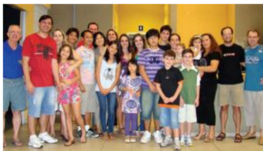
Fraternidad de Maringá - Brasil

En la fraternidad, el espíritu de familia no sólo se manifiesta en los momentos de alegría cuando todos están bien, sino también y, sobre todo, cuando aparecen la enfermedad y la prueba. La fraternidad puede, a veces, atravesar momentos difíciles. En tales circunstancias, cada miembro se esfuerza por ser factor de apoyo y comunión. La fraternidad se convierte igualmente en un campo privilegiado donde se realiza la misión.