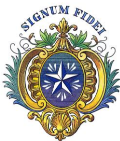
Irmãos das Escolas Cristãs