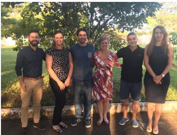
Equipe de Comunicação da Região América Sul - Foto: Ascom

A equipe de Comunicação da Região América-Sul reuniu-se, nesta semana, em Brasília (DF), com o objetivo de atualizar e ajustar o Plano de Comunicação da Região, aprovado pela Assembleia Geral, e avançar quantos aos assuntos dos projetos estratégicos e organizar a identidade visual da 3ª Assembleia Geral dos Conselhos Provinciais da Região América Sul. A reunião da equipe ocorreu na Casa Provincial, da Província Marista Brasil Centro-Norte (PMBCN), entre os dias 10 e 11 de maio.