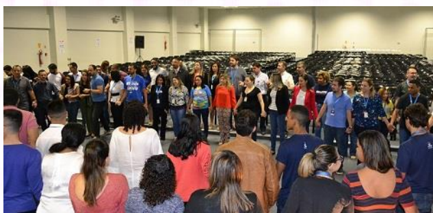
Encontro de Formação, Escritório Central