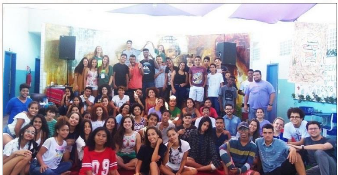
Juventude reunida no CLIMA, da Escola Marista de Terra Vermelha (ES)

As unidades socioeducacionais maristas se movimentam na interdisciplinaridade da vida! Nos últimos dias, foram palco de ações pastorais, de cidadania, de inclusão social, e de conquistas esportivas e culturais. Para começar, entre os dias 4 e 6 de maio, a Escola Marista Champagnat de Terra Vermelha, de Vila Velha (ES), promoveu o Curso de Lideranças Maristas – CLIMA 2018 , que reuniu cerca de 60 jovens na partilha de experiências e sonhos entre a juventude marista, da Pastoral Juvenil Marista (PJM). Entre oficinas, vivências de inserção e celebrações, os jovens puderam ecoar os seus propósitos, intenções e projetos de vida, em uma só voz: “Aqui tem jovem, aqui tem PJM”, o grito que ecoou de Terra Vermelha.