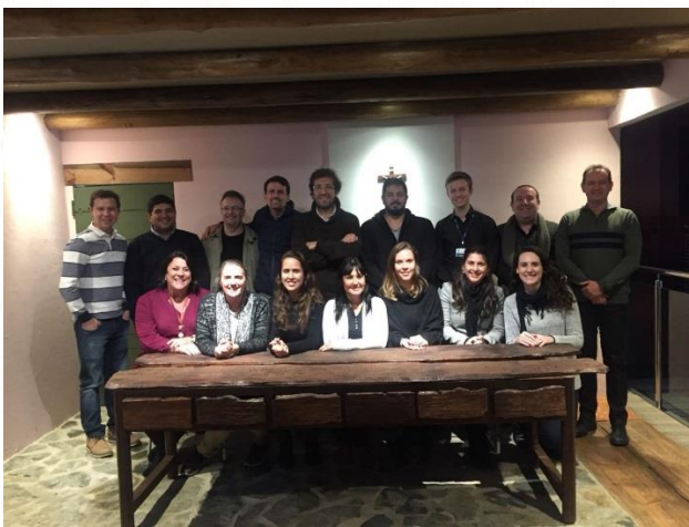
Equipe de Educação da Região América Sul

Nesta semana, entre os dias 18 e 21 de junho, foi realizado, em Curitiba (PR), no Centro Marista Marcelino Champagnat, o terceiro encontro da Rede de Escolas da Região América Sul , que teve como objetivo revisar o Plano Estratégico, discutir novos projetos e atividades, além de apresentar os dados de cada Província participante: as províncias brasileiras, Marista Brasil Centro-Norte, Sul-Amazônia e Centro-Sul; Província Cruz del Sur e Província Santa Maria de los Andes.