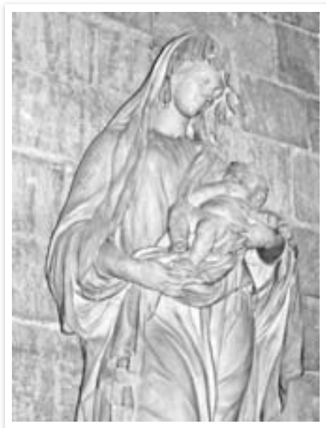
Vierge du Vœu, détail. Rouen.

que le 26 avril [...] cet autel fut consacré par M. François de Harlay l'ancien qui y mit des reliques de S. Paul apôtre et de St Nicaise. Il a été appelé le vœu à cause d'une grande peste qui affligeoit depuis longtemps la ville de Rouen ; ce qui obligea d'avoir recours à la miséricorde de Dieu. »