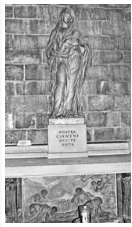
Vierge du Vœu. Rouen.