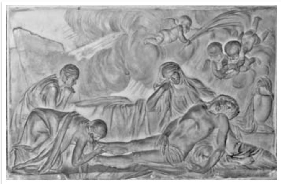
Devant d'autel. Rouen.

Il y a donc eu à Rouen deux Vierges du Vœu et deux jubés. Rien ne semble resté de la première statue et du premier jubé mais il nous reste des représentations iconographiques du second jubé ; et l'autel de la seconde Vierge du Vœu a été soigneusement restauré dans un emplacement nouveau.