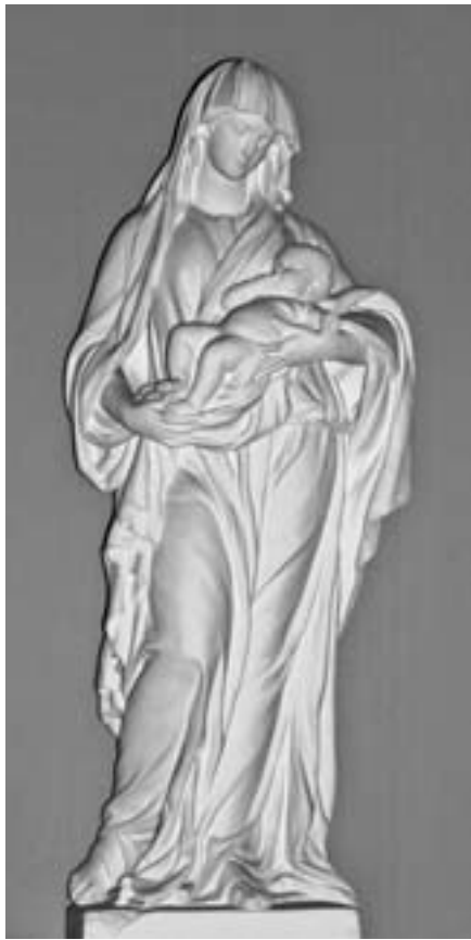
St Christophe la Grotte. Savoie.