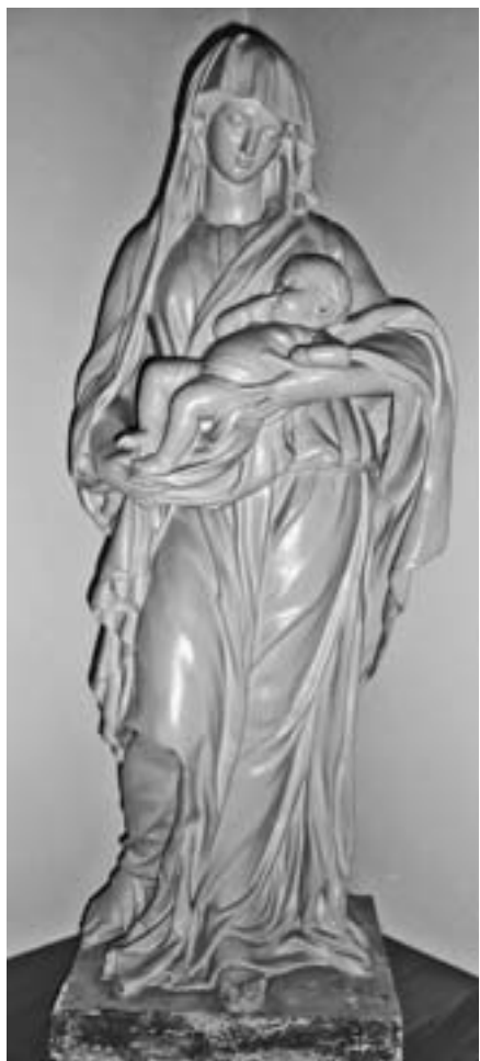
Belley. Sœurs Maristes

Tournon-d'Agenais, en plâtre moulé et peint, de 98 cm de haut et datant