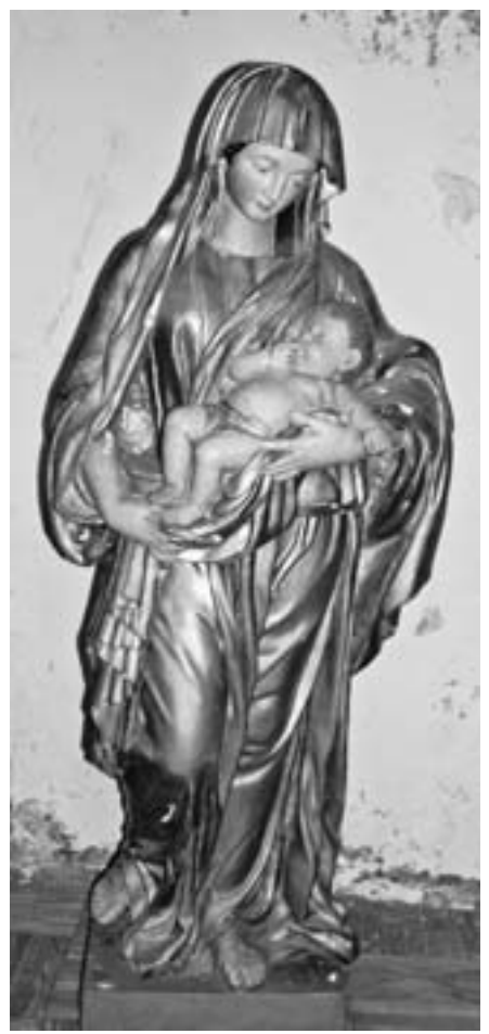
Vierge de Verrens (Savoie)

Ainsi, à Saulgé (Vienne) le prieuré Saint Divitien possède une copie en plâtre de 99 cm de haut, datant du milieu du XIX e siècle. A La Potherie-Mathieu (Eure) l'église paroissiale