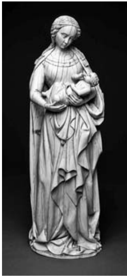
Vierge de Valmont. Rouen

« L'enfant potelé, les cheveux bouclés, est enveloppé dans un lange d'où émerge son torse nu. L'expression triste de la Vierge, qui jette un regard mélancolique sur son fils car elle sait quel sera son