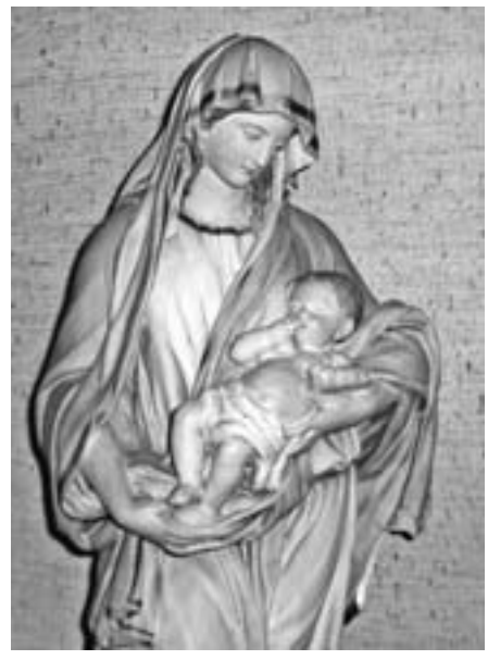
Chimay. Belgique. J. Delen

de Rouen, sont dispersées par la Révolution. Elles se reconstituent à Nesle, au diocèse d'Amiens, en 1804-1816, puis s'installent à Saint Paul-aux Bois en Picardie, au diocèse de Soissons, où elles restent jusqu'à leur exil de France en 1904, suite aux décrets anti-congréganistes. A cette date, la statue, acquise à une époque indéterminée, est confiée à une famille qui la restituera en 2007. Elle est peinte en bleu et blanc. On peut supposer qu'elle a été acquise vers le milieu du XIX e siècle.