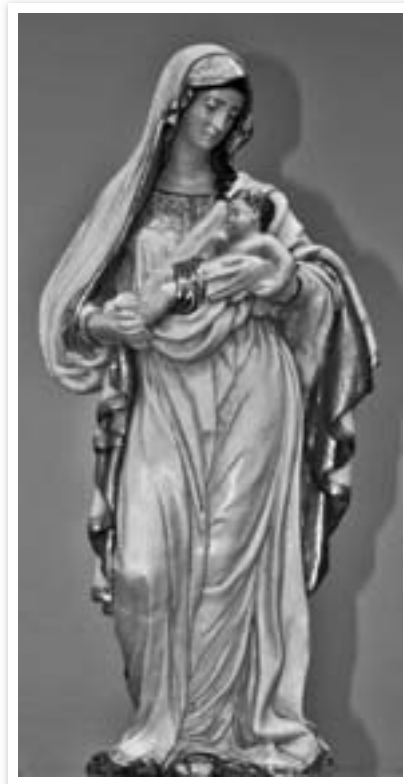
Notre Dame de l'Hermitage. Copie. XX e s.

lution ait fonctionné un atelier de moulage de statues en réduction du modèle de Lecomte fournissant les magasins d'art religieux. D'ailleurs les circonstances s'y prêtaient : après une phase iconoclaste qui avait détruit ou dispersé le mobilier des paroisses et des couvents, ce matériel permettait d'en rétablir une pièce importante rapidement et à bon marché, tout en s'inscrivant en continuité avec la sensibilité esthétique du XVIII e siècle encore tout proche.