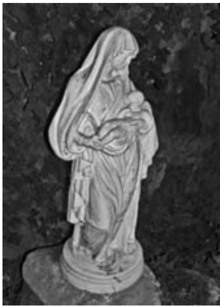
Vierge. Saints Anges de Mâcon (France)

Le F. Carazo attribue à la statue de Rome une hauteur de 75 cm et seulement 68 cm à celle de l'Hermitage, ce qui suggère que les deux statues ne viennent pas du même atelier. Sur