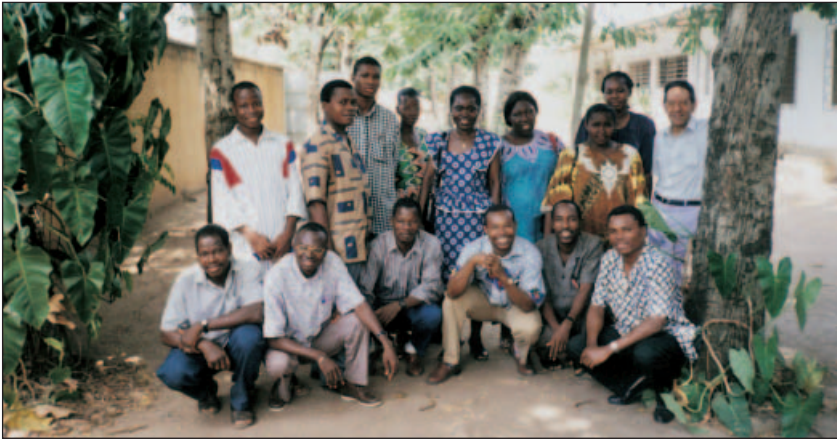
Primeira Fraternidade marista de Costa do Marfim, em Bouaké.

Marcelino. Será um dia completo: acolhida, eucaristia, almoço partilhado com a contribuição de cada um, visita aos lugares maristas, testemunhos, discussão em grupos e animação musical no final. Alguns de seus representantes foram convidados a participar na assembléia provincial, cujo tema é: “Juntos para construir o mundo do ano 2000”.