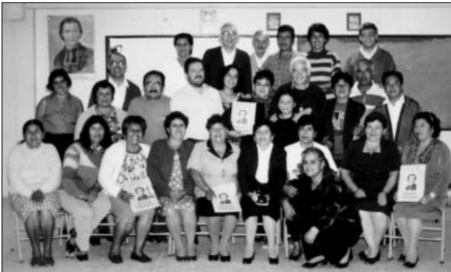
Fraternidade de Catacocha, Equador. Março de 2000.

As fraternidades da França programaram reunir-se em l’Hermitage para celebrar o primeiro aniversário da canonização de São