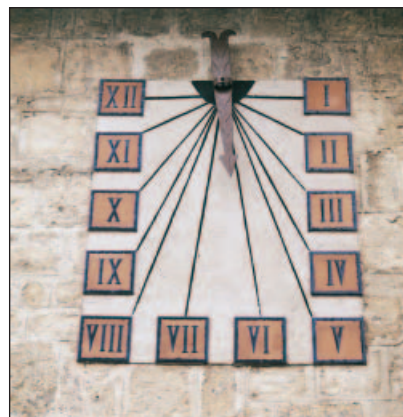
Ha llegado la hora del Capítulo

Felicitemos a las Fraternidades organizadoras de estos encuentros y alentamos a todos a procurar celebrar este tipo de reuniones, tan propicias para crear fraternidad, favorecer el conocimiento más profundo del carisma y animarse a encontrar nuevas maneras de vivirlo en los diferentes ambientes. ♦