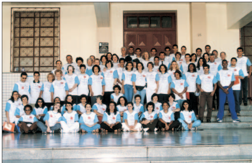
Reunión de Fraternidades en Patos de Minas, Brasil, 2-3 junio 2001

El Capítulo general de 1985, como recordarán, creó el Movimiento Champagnat de la Familia Marista y estableció su identidad en el artí-