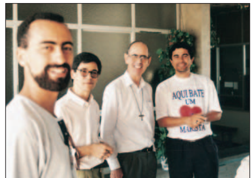
Reunión con hermanos en Brasil

Mi deseo personal en síntesis: más Espíritu y menos política. Amén. ♦