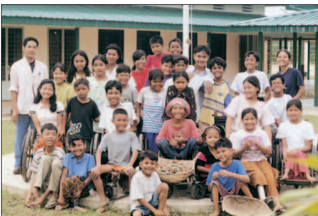
Dispuestos para trabajar en jardinería, después de las clases

Nº 37 – Año 14 – Septiembre 2001 INSTITUTO DE LOS HERMANOS MARISTAS