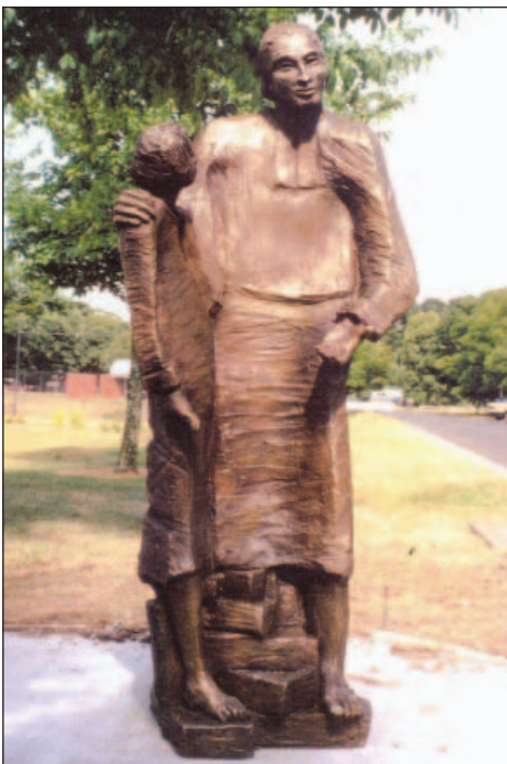
San Marcelino por Pauline Clayton. Assumption College Kilmore, Victoria, Australia

Al principio de su ministerio, en La Valla, comienza su obra. En ese pueblo de unos 2500 habitantes, repartidos en unos cincuenta caseríos, el joven vicario hace maravillas. “Sus modales sencillos y afables, la franqueza y el aspecto bondadoso que se dibujaba en su rostro, cautivaba los corazones ... Es tan bueno, que no hay más remedio que hacer lo que manda o aconseja” (Vida p. 274).