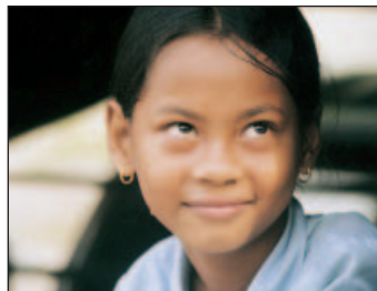
Sonrisa de esperanza

La Camboya de hoy tiene la andadura de los niños cojos que viven en Takmao. 75 niños, víctimas de los campos de minas, de incidentes del trabajo y de la polio. 75 vidas "diferentes", pero con mucha ansia de levantarse y de caminar. La vida respira a pleno pulmón, la alegría de la niñez capaz de superar las asperezas del camino. A estos niños, muchas veces abandonados durante la noche ante una verja del centro, se les da la oportunidad de estudiar, de curarse, de vivir una vi-