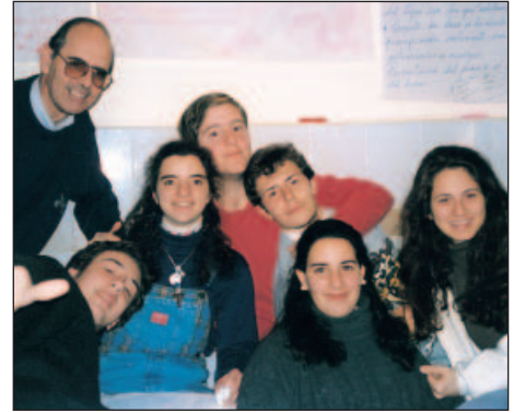
Con jóvenes universitarios en Luján, Argentina

Dar un testimonio de discípulos de Jesús, apasionados por su persona y por su Evangelio, así como el testimonio de la fraternidad y de la igualdad (nadie debe sentirse ni hacer sentir que es más que los otros). Vivir la hermosa diaconía de estar junto a los más pequeños para