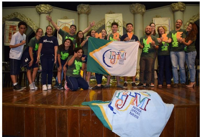
PJM - Marista Champagnat Taguatinga

Na última quinta-feira (01/03), foi realizada, no Colégio Marista Champagnat, de Taguatinga (DF), a videoconferência de abertura das atividades da Pastoral Juvenil Marista 2018 (PJM) , que contou com a participação de, aproximadamente, 420 alunos, e de 28 unidades socioeducacionais, além das equipes das Coordenações de Evangelização e de Solidariedade, da Superintendência de Missão, da Província Marista Brasil Centro-Norte (PMBCN).