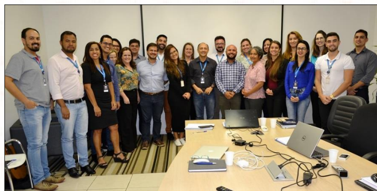
Equipe da Superintendência de Missão

A Superintendência de Missão, da Província Marista Brasil Centro-Norte (PMBCN), se reuniu, na última semana de fevereiro (26/02), com as unidades socioeducacionais, para realizar a abertura do ano letivo 2018 . O encontro se deu por meio de videoconferência, e agrupou os gestores das unidades com todas as coordenações que compõem a Gerência Socioeducacional, da Superintendência de Missão: coordenações Administrativa, Educacional, Evangelização, Negócios e Solidariedade.